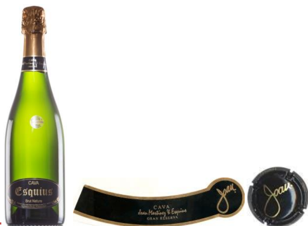
Ref. 7 - SINGULAR G.R. Chardonnais